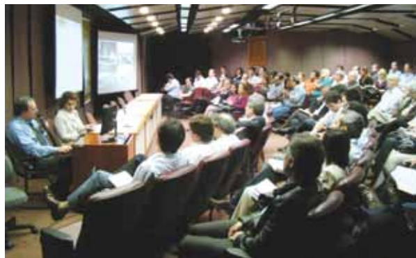
As reuniões do PEN 2010 lotaram o auditório do Escritório Central do ONS.

“O PEN 2010 apontou ainda uma tendência de mudança no perfil da oferta de energia. Embora a hidroeletricidade siga como principal fonte de produção de energia elétrica, sua participação na matriz do SIN deverá cair de 81%, em 2009, para 71%